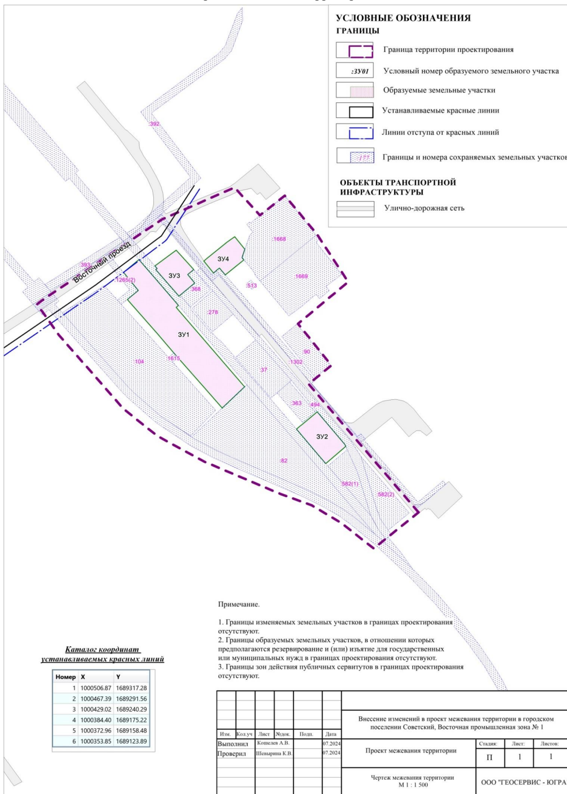
Чертёж межевания территории